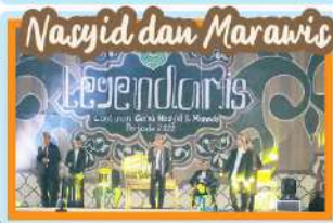
Nasyid dan Marawis Legendoris